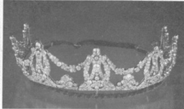
Madonna's trouwtiara dateert uit 1910.

juwelen al snel kitsch, vind ik.' Wat vind je van de juwelen die Sophia Loren droeg voor een fotoshoot van Vogue? Alleen al het collier bevatte 1.600 diamanten.